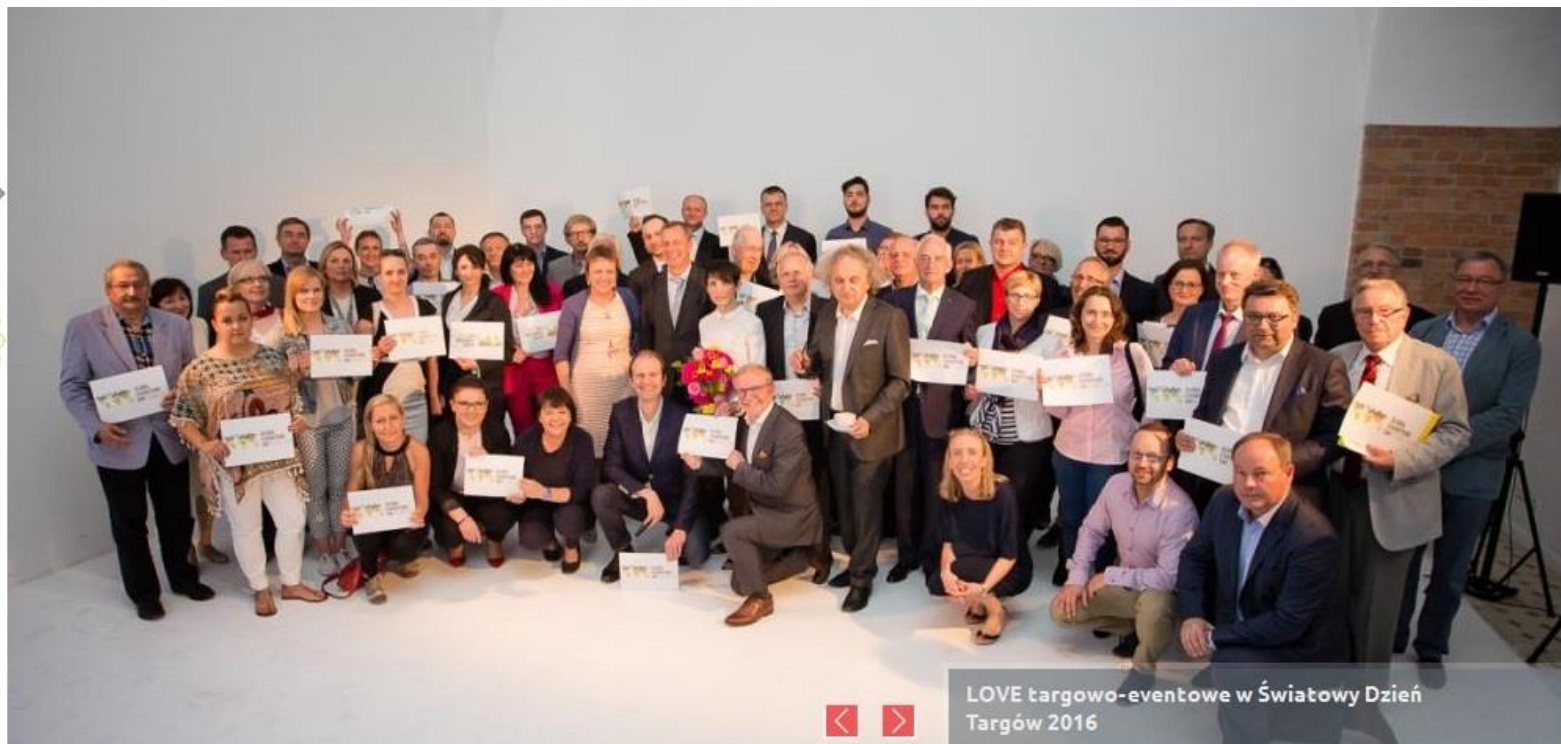
LOVE targowo-eventowe w Światowy Dzień Targów 2016