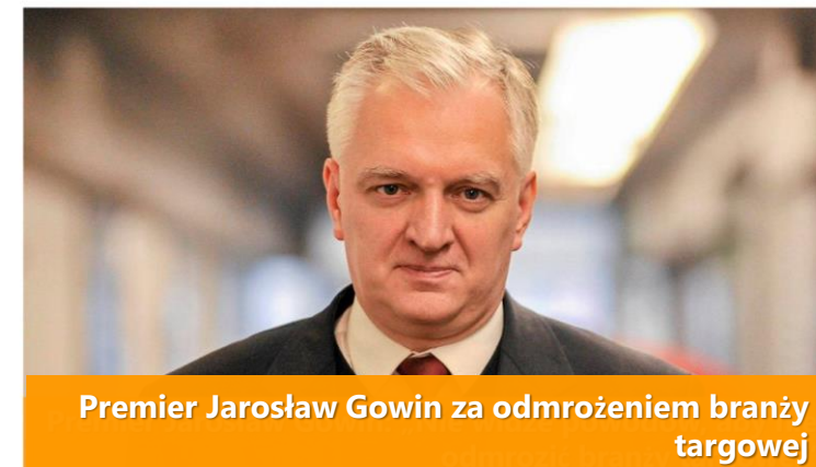
Premier Jarosław Gowin za odmrożeniem branży targowej