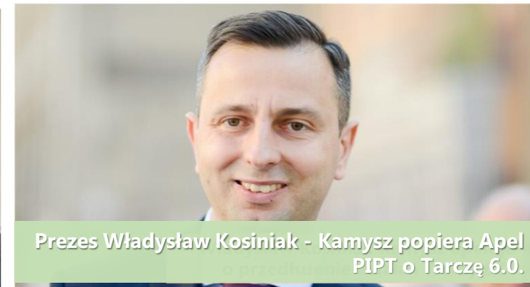
Prezes Władysław Kosiniak - Kamysz popiera Apel PIPT o Tarczę 6.0.