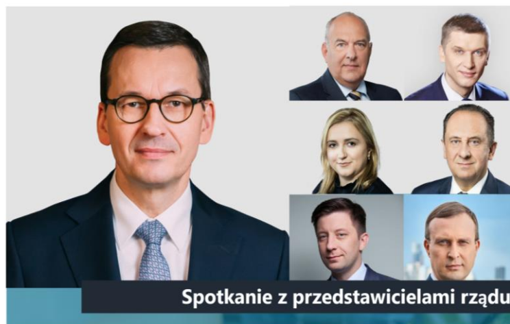
Spotkanie z przedstawicielami rządu