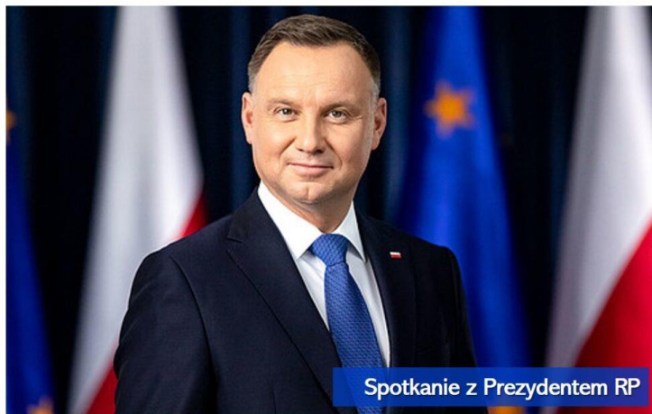
Spotkanie z Prezydentem RP