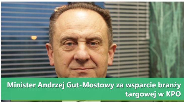
Minister Andrzej Gut-Mostowy za wsparcie branży targowej w KPO