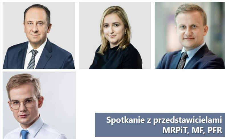
Spotkanie z przedstawicielami MRPiT, MF, PFR