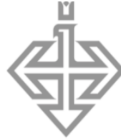
KRAJOWA IZBA GOSPODARCZA